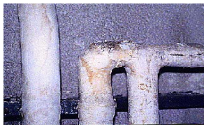
Calorifugeage de tuyaux