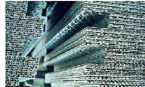
Plaques de faux-plafond