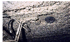
Flocage de plafond