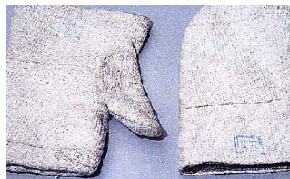
Gants de protection