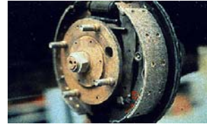
Garnitures de frein