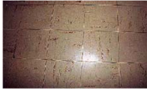
Dalles de sol