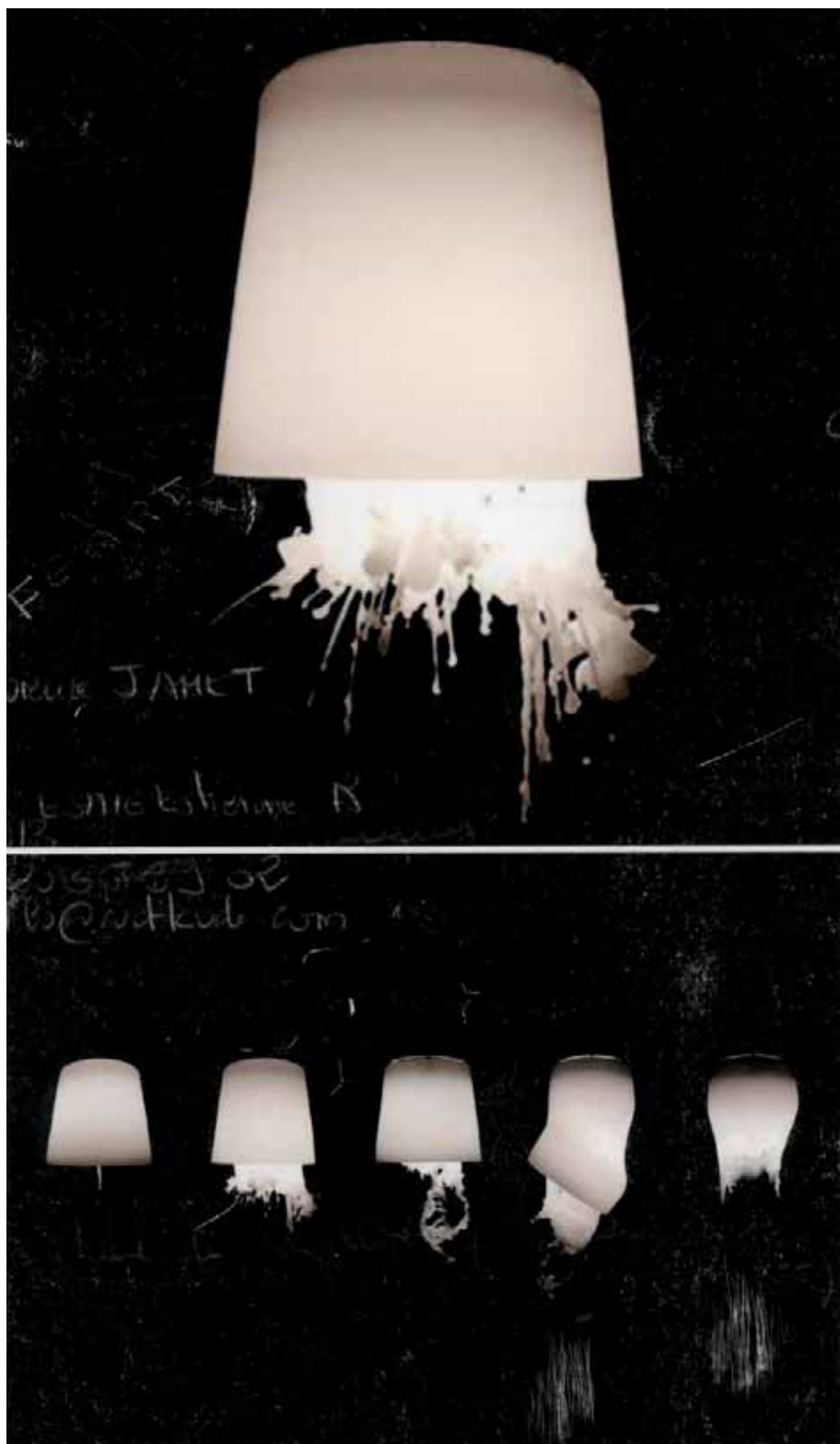
Aylin KAYSER & Christian METZNER, Wachslampe , 2009. Lampe avec abat-jour en cire.