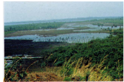
Plantation de palétuviers en Sierra Leone.