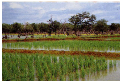
Parcelles de rizières inondées (période de croissance)