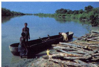
Coupe du bois.