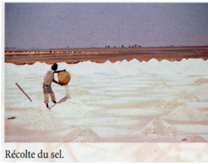
Récolte du sel.