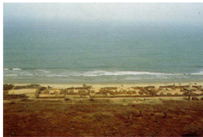
Campement de pêcheurs migrants maritimes.