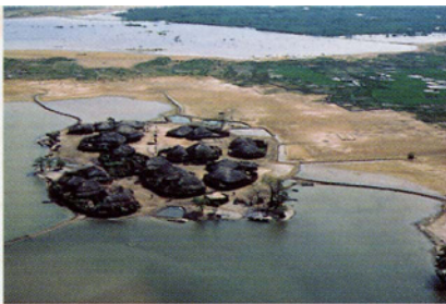
Village de mangrove.