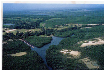
Écosystème à mangrove