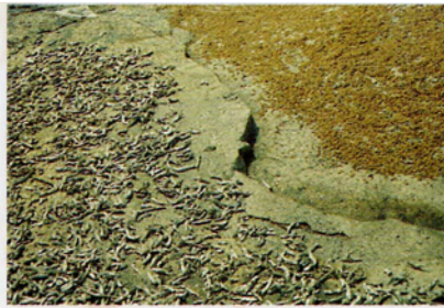
Riz et poisson (ici, alevins), les deux aliments de base des populations.