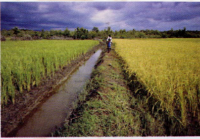
Intensification rizicole : polder expérimental à Koba.