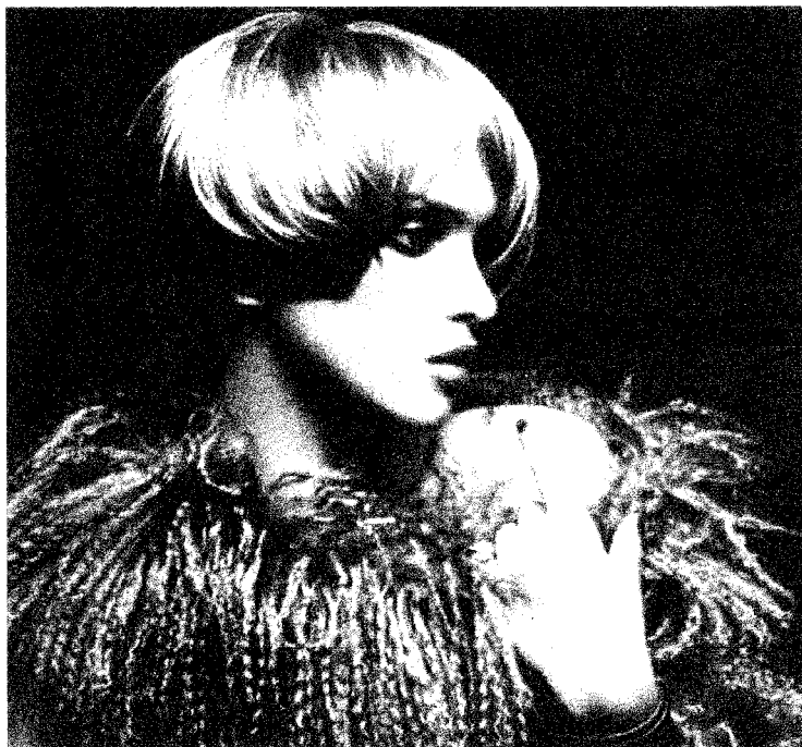
DESSANGE Magazine N°36