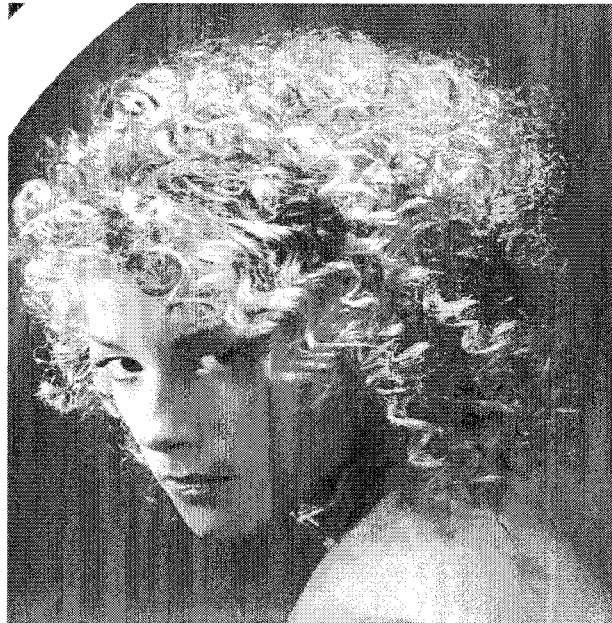
HAIR STYLE GALLERY collection 2005-2006 WELLA