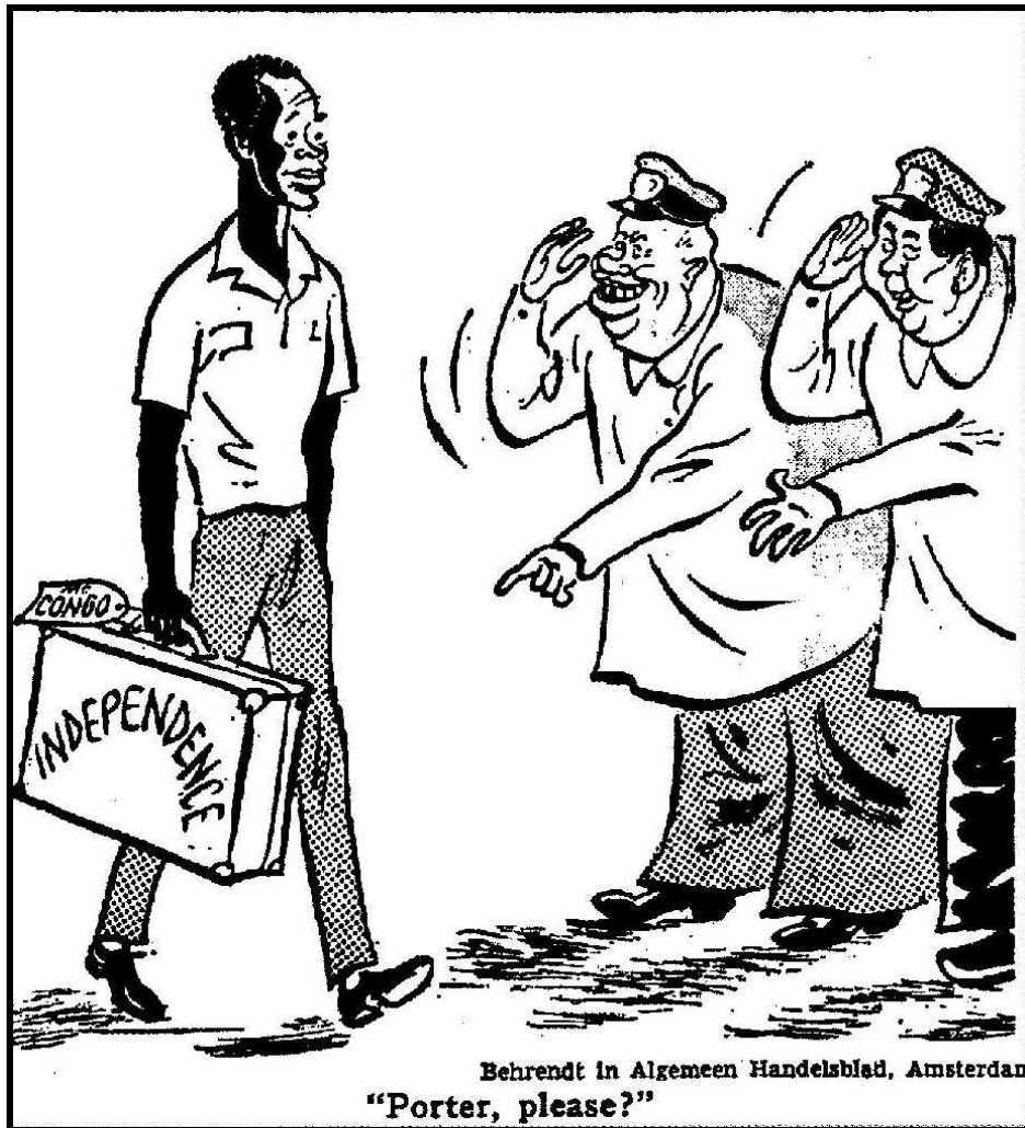
Document 2. Caricature publiée dans New York Times , 10 juillet 1960.

Note : Nikita Khrouchtchev et Mao Zedong disent à Patrice Lumumba « Porteur, s'il vous plait ? ».